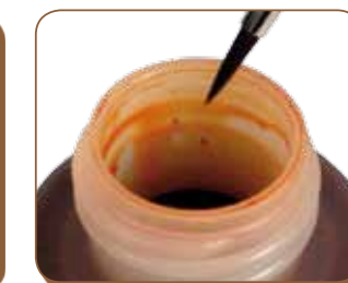
Boca ancha / Wide mouth