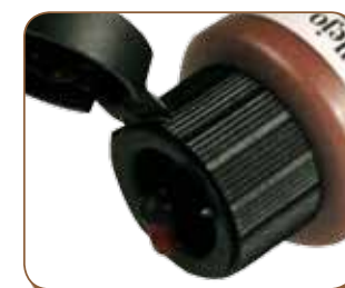
Cuentagotas / Eyedropper